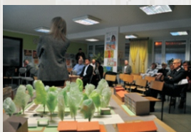
Konsultacje z mieszkańcami - prace nad koncepcją dla Rudy Śląskiej