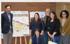
Wielodyscyplinarne zespoły projektowe