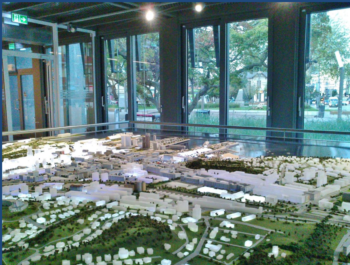
InfoBox Obserwatorium zmian, Gdynia