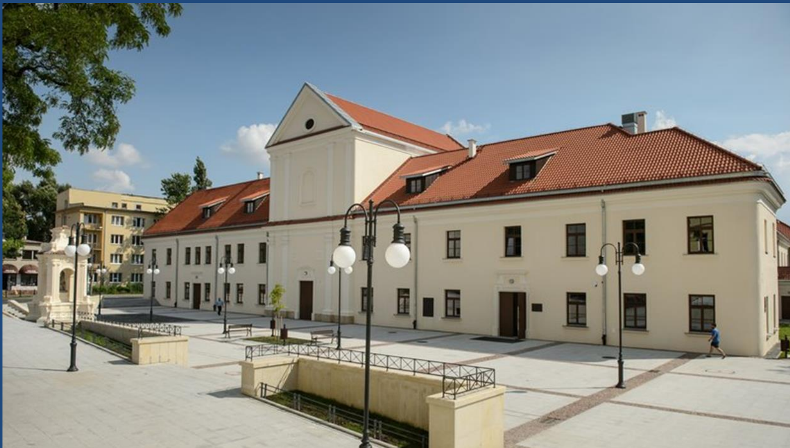
Plac przed Centrum Kultury, Lublin