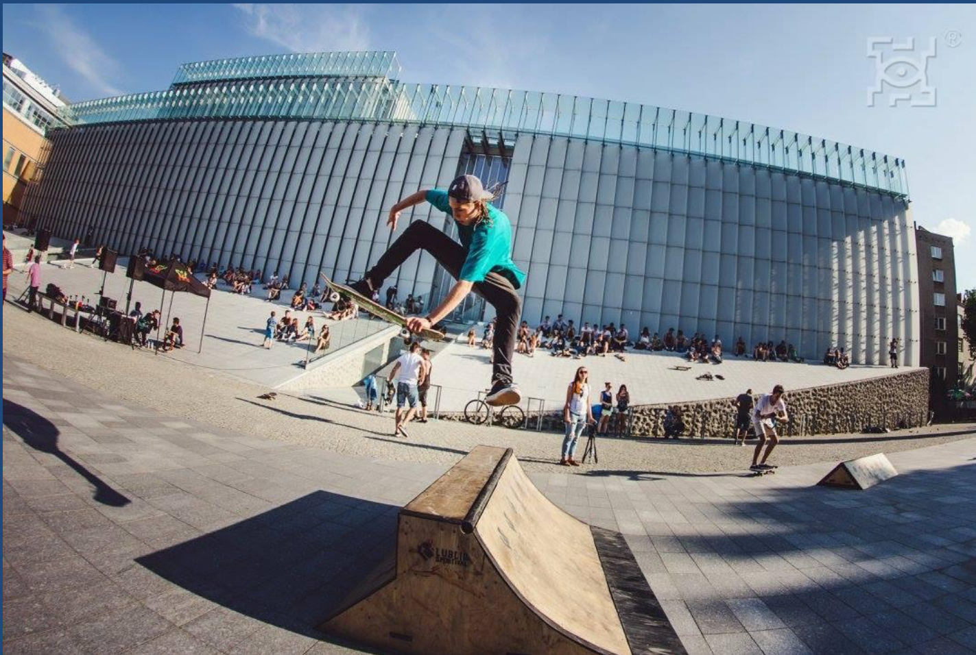
Plac Teatralny, Lublin

Projektowanie uniwersalne jako narzędzie procesu rewitalizacji, ŚZGiP, Katowice 2017