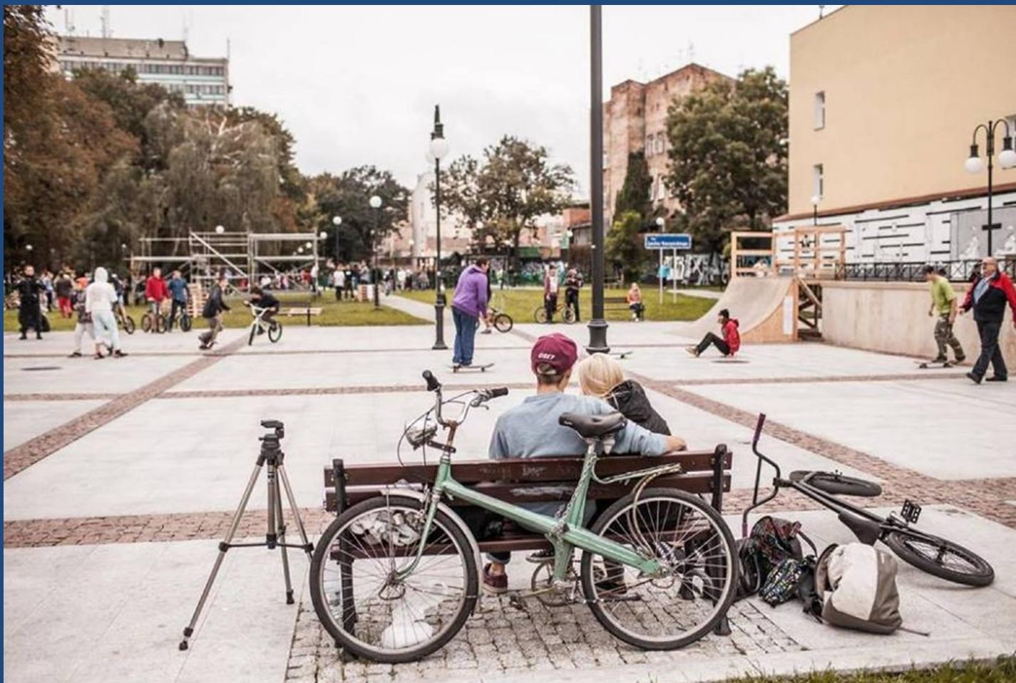
Plac przed Centrum Kultury, Lublin

Projektowanie uniwersalne jako narzędzie procesu rewitalizacji, ŚZGiP, Katowice 2017