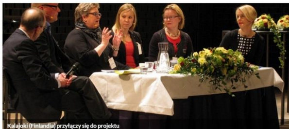
Kalajoki (Finlandia) przyłączy się do projektu

Chorwacja zaprasza do tworzenia sieci i partnerstw 18 sierpnia 2015