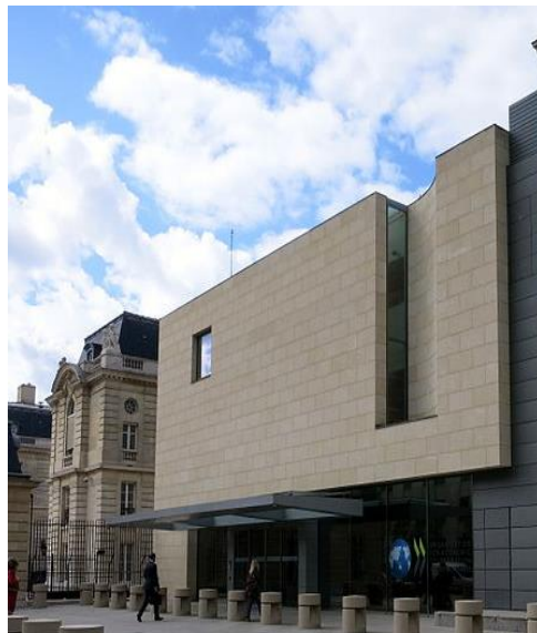
Siedziba OECD w Paryżu