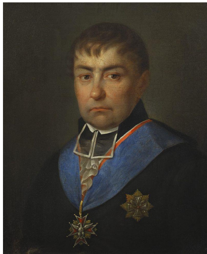
Hugo Kołłątaj podkanclerzy koronny 1791