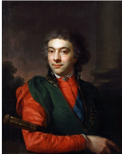
Nestor Sapieha Marszałek Konfederacji W.Ks.Litewskiego