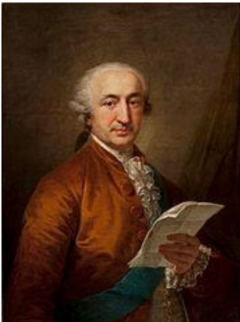
Stanisław Małachowski Marszałek Sejmu Wielkiego