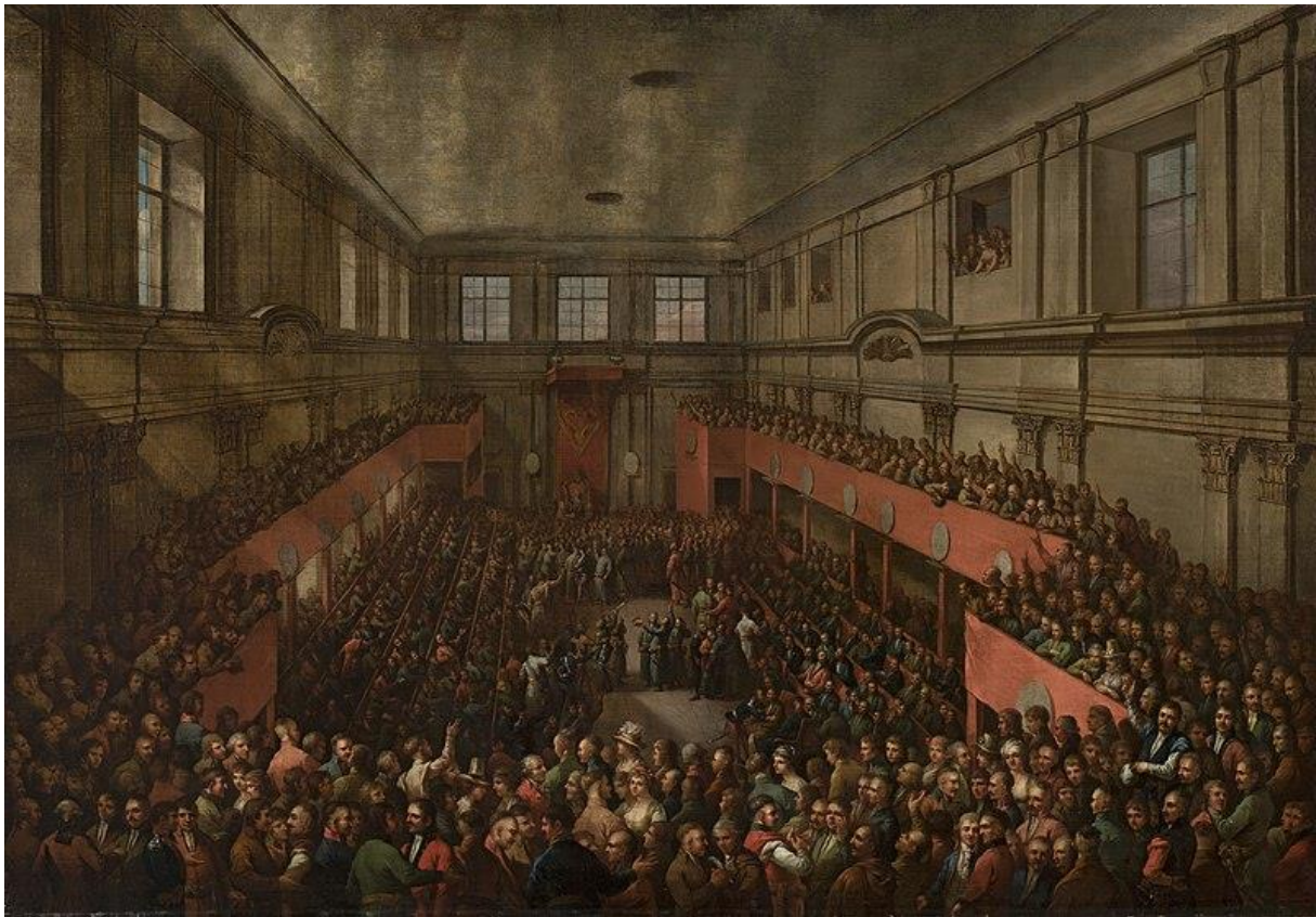
Zaprzysiężenie Konstytucji 3 Maja (obraz Kazimierza Wojnarowskiego)