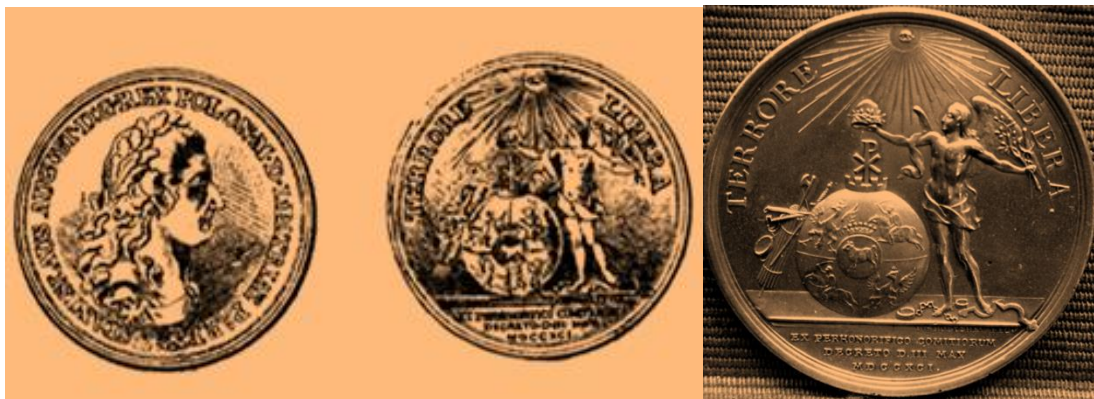
Wzory medali wybitych dla upamiętnienia Konstytucji