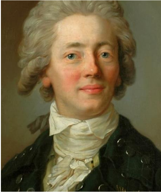
Stanisław Konstanty Potocki poseł na Sejm Wielki