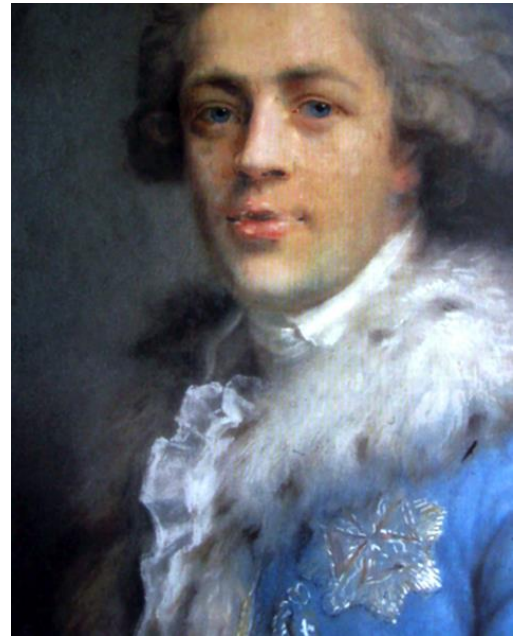
Ignacy Potocki Marszałek Wielki Litewski 1791-1794