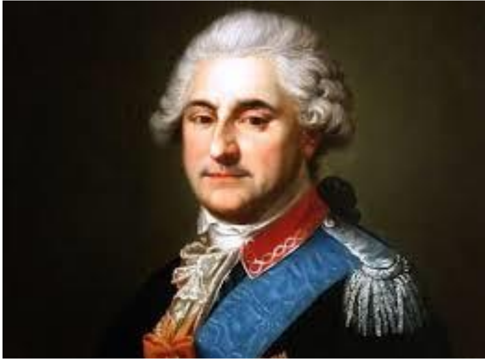
Król Polski doby reform i Sejmu Wielkiego Stanisław August Poniatowski