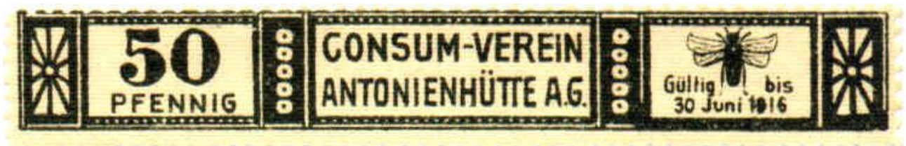
Wreckie notgeldy Związek Spożyców „Antonienhutte” mający swoją siedzibę w Wirku, powstał z końcem XIX