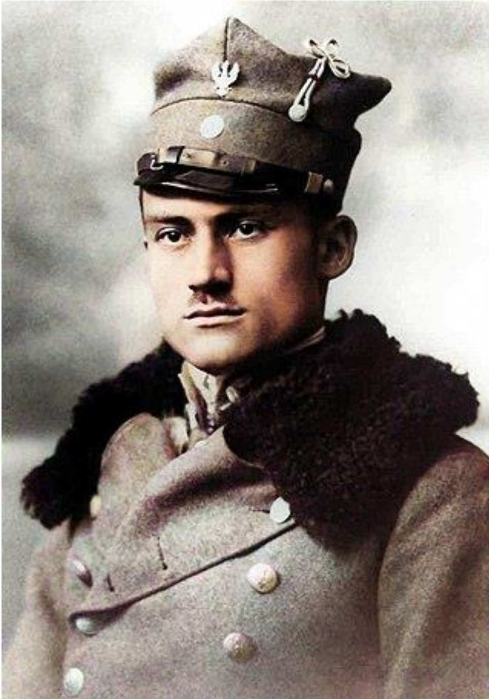
Stanisław Krzyżowski dowódca I Powstania Śląskiego